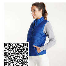
OSLO WOMAN RA5093