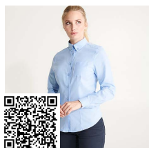
OXFORD WOMAN CM5068