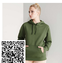
URBAN WOMAN SU1068